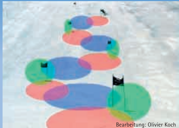
Bearbeitung: Olivier Koch

Je höher die situative Schlagfertigkeit des Handelnden im Wettkampf ist, desto besser und schneller wird sein Resultat sein. Anpassung und Dosierung sind zweifelsohne Schlagwörter für den Skifahrer. Sie sind Synonym für die wirksame Beherrschung des Gleichgewichts, die es erlaubt, die Strecke zwischen Start und Ziel schnellstmöglich zu durchlaufen. In genau dieser Optik müssen alle Lern- und Ausbildungsbemühungen betrachtet werden. Dabei hat eine elegante Ausführung der Bewegungen im Wettkampf keine Bedeutung. Unter dem Gesichtspunkt, dass eine optimale Dosierung der Energie die Leistung verbessert, bleiben Eleganz und Ästhetik ohne Einfluss. Die einzigen gefragten Handlungen sind jene, die zur Verminderung der Gesamtzeit beitragen. Viele Kompetenzen sind gefragt, damit dieses Ziel erreicht wird. Kompetenzen, die nicht auf einer kraftvollen Handlung beruhen, sondern auf die während des gesamten Lernprozesses zugesteuert wird. Die wesentliche der im Wettkampf eingesetzten Formen besteht darin, die wirksamste und schnellste Art des Gleitens zu realisieren. Geschwindigkeit im Ski-