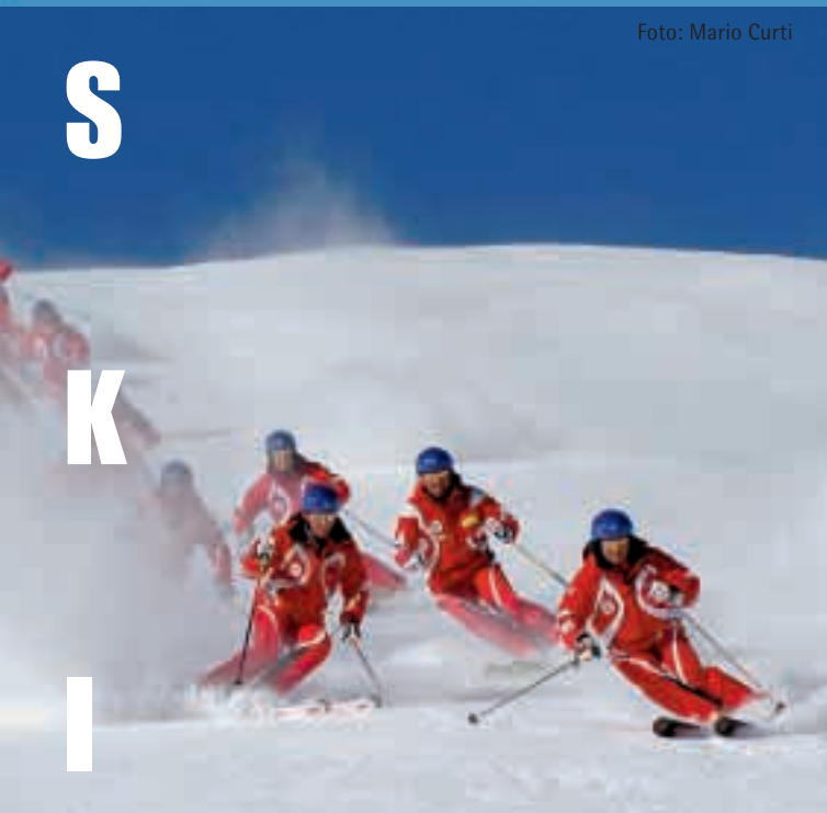
Das SWISS SNOW DEMO TEAM in voller Fahrt – Airolo, März 2004