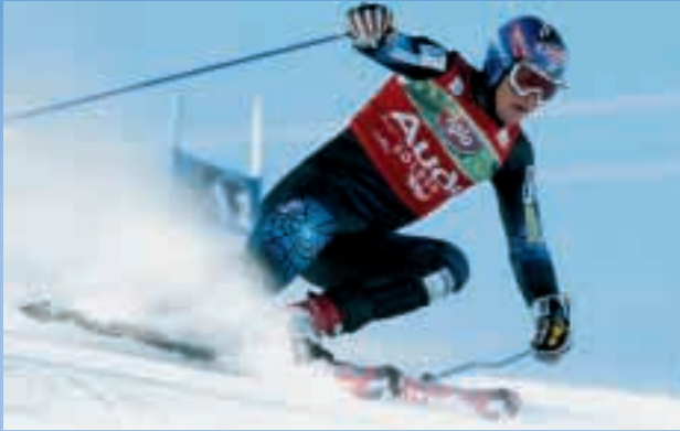
Bode Miller – RS Sölden, Oktober 2004