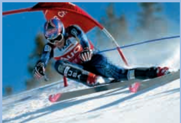
Bode Miller – A Beaver Creek, Dezember 2004